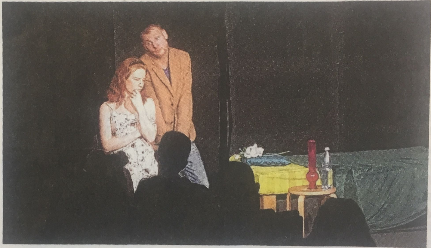
Der „Weimarer Kulturexpress“ war an der Kaufmännischen Schule in Ehingen zu Gast mit einem Stück zur Drogenprävention.